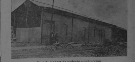
Casa de madera de reciente construcción.