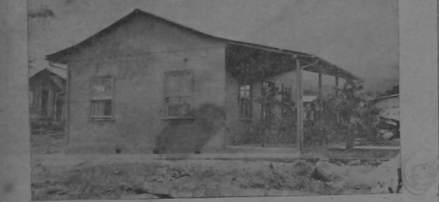
Modelo de casa de madera construida por don Manuel Ulloa.